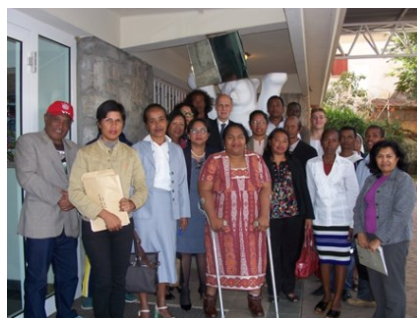
Les membres de groupements bénéficiaires de micro-projets en 2017

Des ONG, associations ou autres groupes d'entraide dont le siège social se trouve à Madagascar et dont la forme juridique est conforme à la loi malgache. Des congrégations ainsi que des autorités locales (Fokontany, etc.) peuvent aussi déposer des demandes. Dans tous les cas, l'institution réalisant le projet en est directement responsable pour tous les aspects de la gestion; cela inclut un décompte détaillé auprès de l'Ambassade.