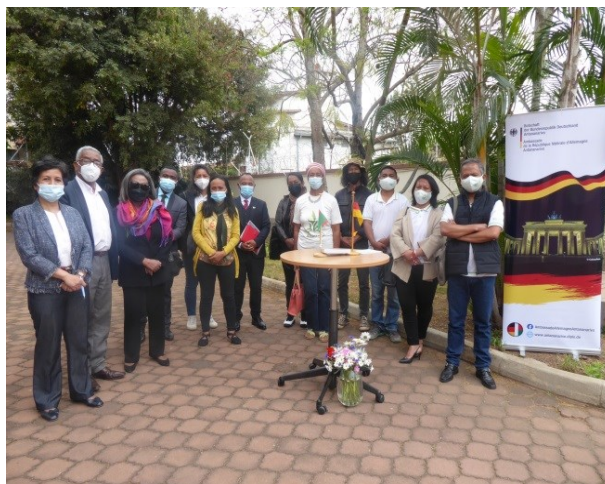
Les membres de groupements bénéficiaires de micro-projets en 2021

Des ONG, associations ou autres groupes d'entraide dont le siège social se trouve à Madagascar et dont la forme juridique est conforme à la loi malgache. Des congrégations ainsi que des autorités locales (Fokontany, etc.) peuvent aussi déposer des demandes. Dans tous les cas, l'institution réalisant le projet en est directement responsable pour tous les aspects de la gestion; cela inclut un décompte détaillé auprès de l'Ambassade.