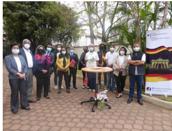
Les membres de groupements bénéficiaires de micro-projets en 2021

Des ONG, associations ou autres groupes d'entraide dont le siège social se trouve à Madagascar et dont la forme juridique est conforme à la loi malgache. Des congrégations ainsi que des autorités locales (Fokontany, etc.) peuvent aussi déposer des demandes. Dans tous les cas, l'institution réalisant le projet en est directement responsable pour tous les aspects de la gestion; cela inclut un décompte détaillé auprès de l'Ambassade.