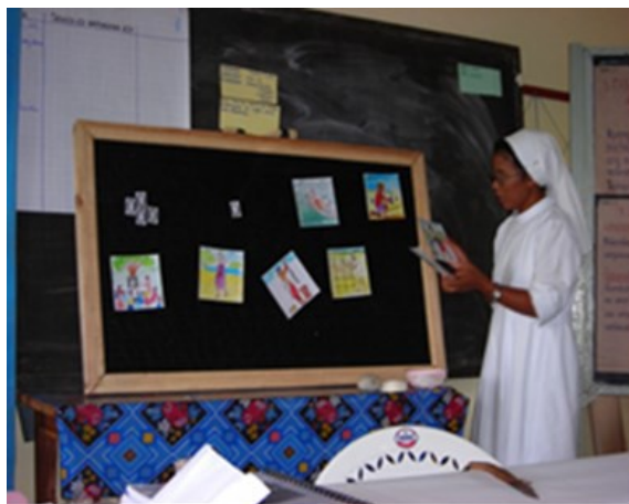
Education environnementale en milieu scolaire, Antsiranana

Tous les dossiers de demande seront dûment examinés par rapport à d'autres projets qui nous ont été proposés. Seuls les projets montrant une contribution considérable de la population bénéficiaire et visant clairement à une amélioration des conditions de vie des couches sociales les plus défavorisées seront pris en considération. Une « contribution considérable » des bénéficiaires peut consister à des travaux, voir des apports financiers ou matériels.